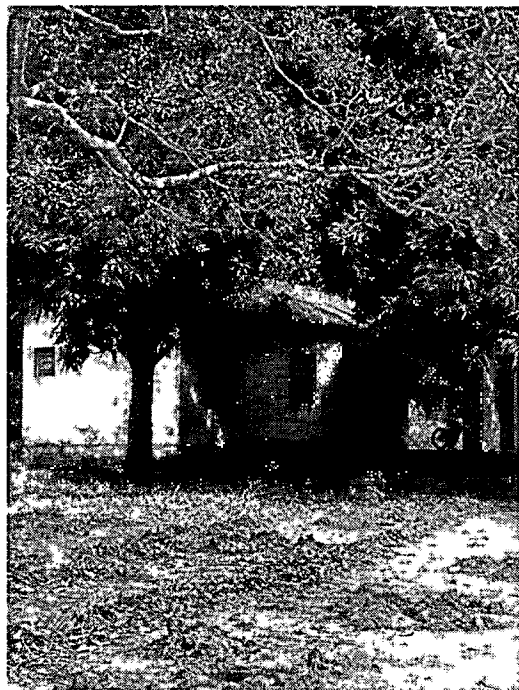
CASA QUE SOLICITO A REFORMA.