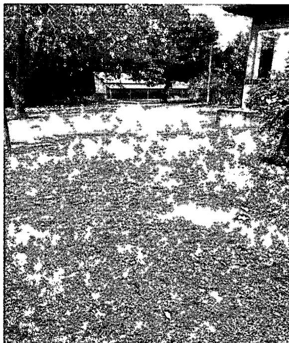
ESPAÇO UTILIZADO COMO REFEITORIO DOS PROFESSORES.